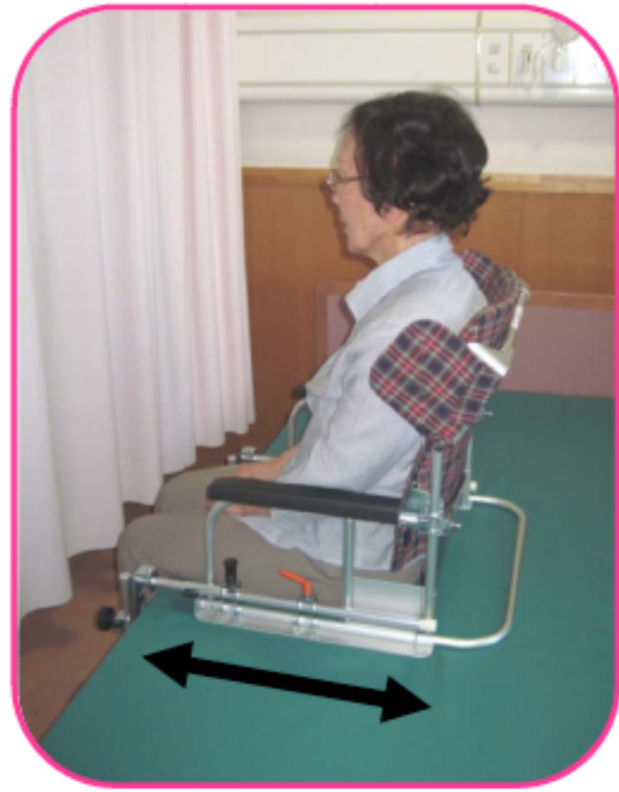
体格や円背・変形に合わせ、背もたれ位置を前後に調整できます。