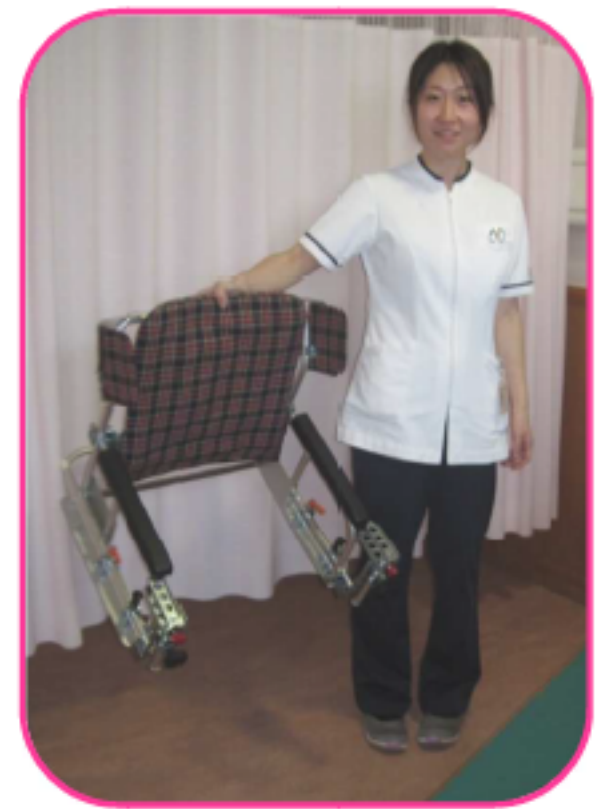
片手で軽く持ち上げられます。 女性でも楽々 重さ 4.6kg