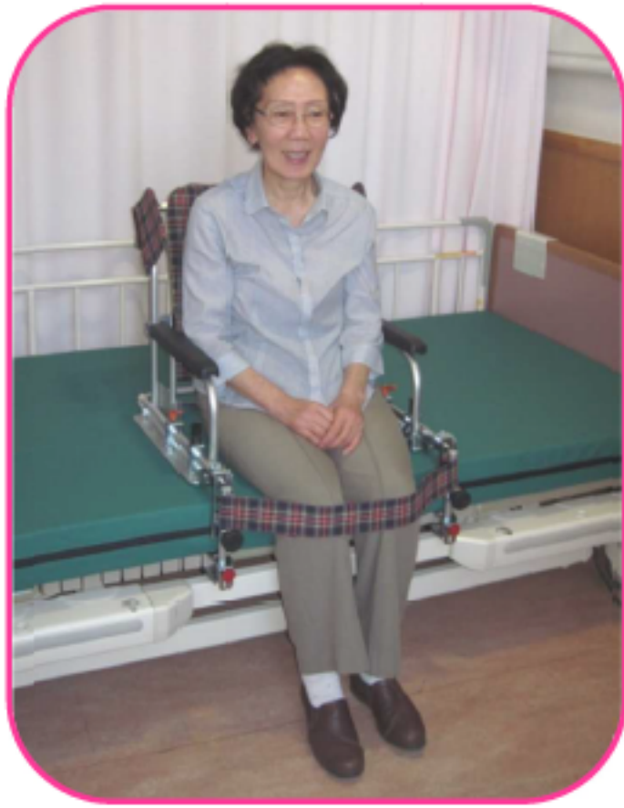
滑り落ちを止める足ベルトがあり安心です。ベッドの高さ調節機能を利用して、座面高さが容易に変えられます。