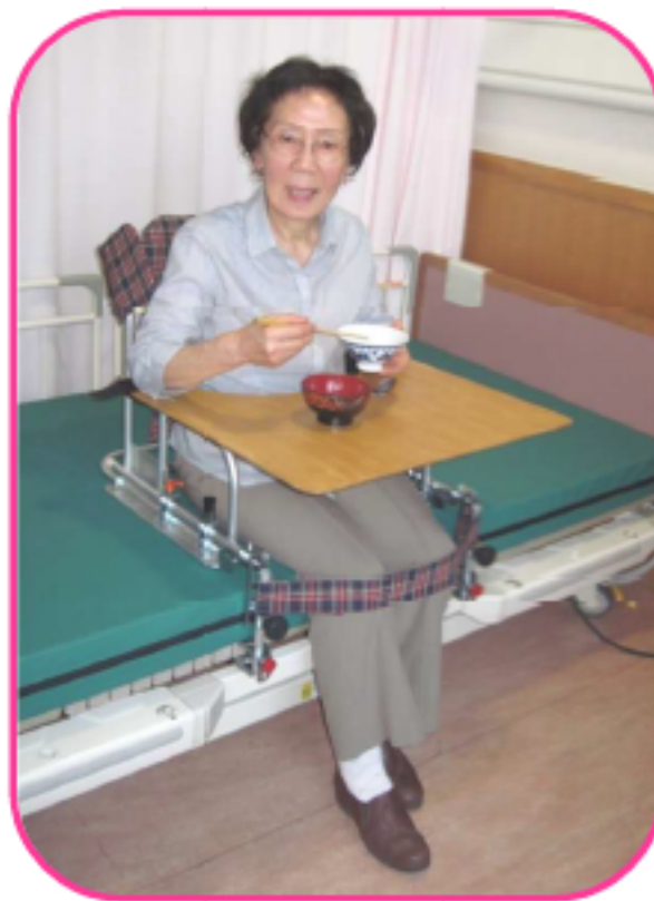
カッターテーブルとの組み合わせで、食事や読書が楽にできます。